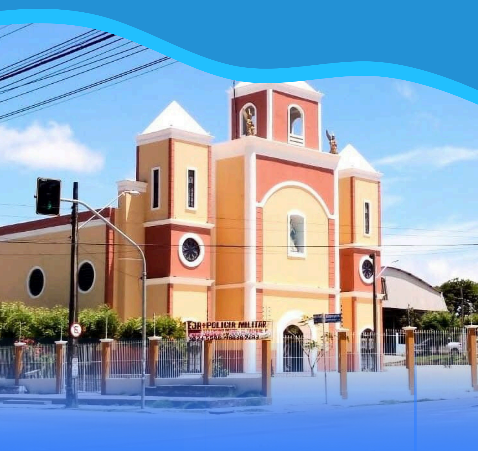
Igreja Matriz da Paróquia Nossa Senhora da Conceição, Conjunto Ceará, Fortaleza Avenida Ministro Albuquerque Lima, 335, I etapa – Contato: (85)3294-6410