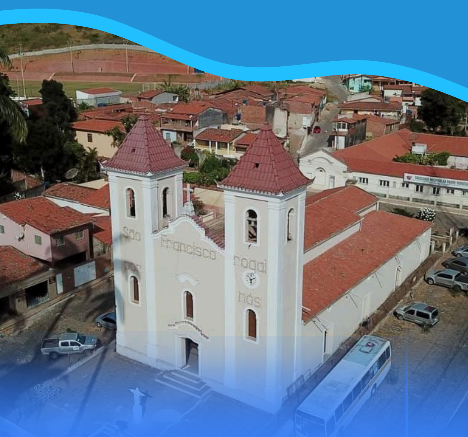
Igreja Matriz da Paróquia São Francisco de Paula , Centro, Aratuba Avenida Arlindo Medina, s/n – Contato: (85) 3329-1102