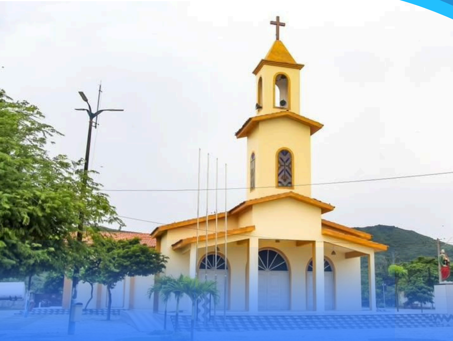
Igreja Matriz da Paróquia São Pedro , Centro, Barreira Rua Alexandre Joca, s/n - Contato: (85) 99219-4583